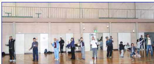
全員で一斉に飛ばしました